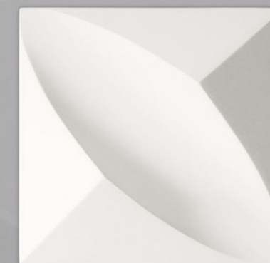
Bloom White Ref.: PC 906-01 20cm x 20cm Espessura: 5cm