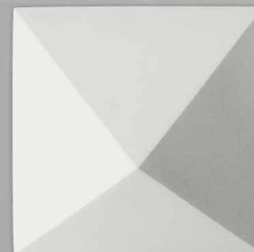
Egypt White Ref.: PC 903-01 20cm x 20cm Espessura: 7cm