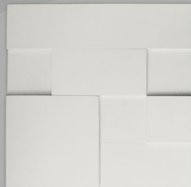
Mosaic Slick White Ref.: PC 901-01 Espessura: 1,2cm e 2cm Kit contendo peças nos tamanhos: 10cm x 10cm 10cm x 20cm 10cm x 40cm 20cm x 20cm 40cm x 40cm