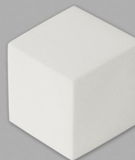
Hex White Ref.: PC 902-01 15cm x 17,3cm Espessura: 2,5cm