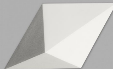
Diamond White Ref.: PC 907-01 30cm x 17,3cm Espessura: 7cm