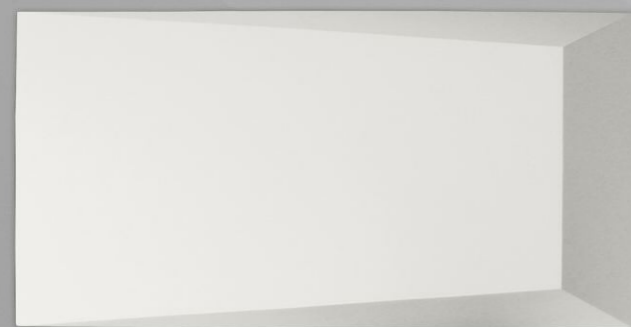
Rise White Ref.: PC 904-01 30cm x 60cm Espessura: 7cm