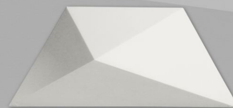
Trapez White Ref.: PC 908-01 15cm x 34,6cm Espessura: 7cm